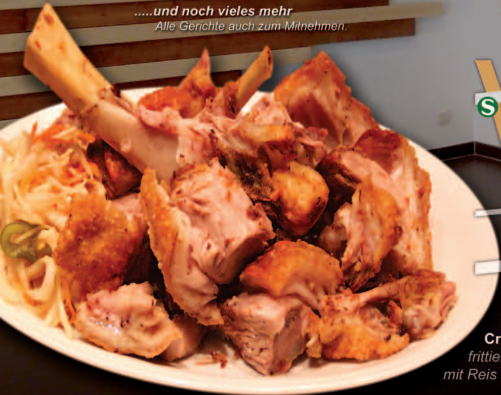
Crispy Pata frittierte Schweinehaxe mit Reis serviert